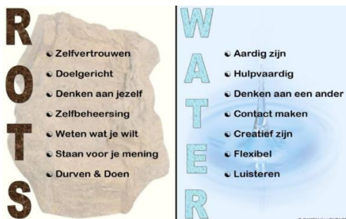
Rots en water